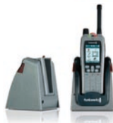
Asztali töltő állomás 1405.120-00004