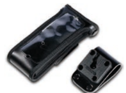
Bőrtok, 2-es típus 1405.120-00009