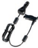
Utazó töltő 1405.120-00020