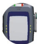
Akkumulátor rezgő hívásjelzéssel 1405.110-30002