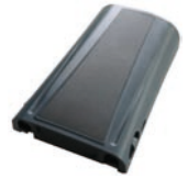
Akkumulátor GPS vevővel és rezgő hívásjelzéssel 1405.110-30001