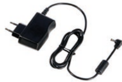
Asztali töltő 1405.120-00003