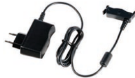
Hálózati adapter 1405.120-00005