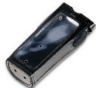
Bőrtok, nyitott 1405.120-00007