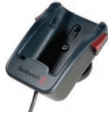
Autós töltő 1405.120-00019