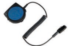
Noise com headset, mini beszédgomb (PTT) a headset-en 1405.120-00017